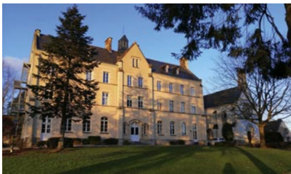
Le CADA de Châteaubourg

avec deux échéances, l'une à court terme pour installer les demandeurs d'asile (actuellement sur Vitry et Rennes) et l'accueil d'urgence de familles ; l'autre à plus long terme pour imaginer le « village des solidarités » projeté avec la mairie de Châteaubourg (Nous y reviendrons prochainement).