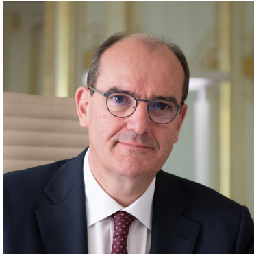
Jean Castex, Premier ministre

Déclaration de politique générale Assemblée nationale, 15 juillet 2020